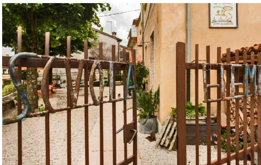
De sfeervolle binnenplaats van La Scuola is een ontmoetingsplek. Dorpsbewoners vertellen gasten hier graag over hun schooltijd.

> In haar ontwerp combineerde ze vintage meubels en schoolspullen met moderne en industriële elementen. Ze koos voor ijzeren trappen en stalen retro stoelen van het Franse designmerk Les Gambettes, maar ook voor antieke houten stoelen, tafels en kasten. “Ik heb veel meubels en muren pastelkleuren gegeven. Ondanks het schoolthema wilde ik een vrolijke en huiselijke sfeer creëren. Daarom hebben we in de eetkeuken ook een houtkachel en een knaloranje koelkast geplaatst. Door de wand van schoolbordverf blijft de uitstraling toch heel schools.”