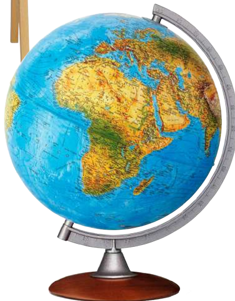
Wereldbol Globe 90 Atlantis van kunststof, de voet is van hout. Ø 30 cm. € 47,95 (DEZWERVER.NL)