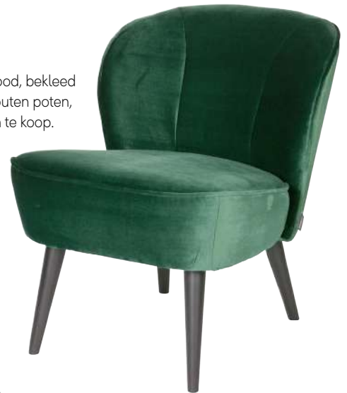
Fauteuil Sara van Wood, bekleed in fluweellook met houten poten, ook in andere kleuren te koop. € 199 (LIL.NL)