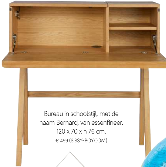
Bureau in schoolstijl, met de naam Bernard, van essenfineer. 120 x 70 x h 76 cm. € 499 (SISSY-BOY.COM)

Creëer de sfeer van een oud klaslokaal met retro schoolaccessoires en vintage meubels.