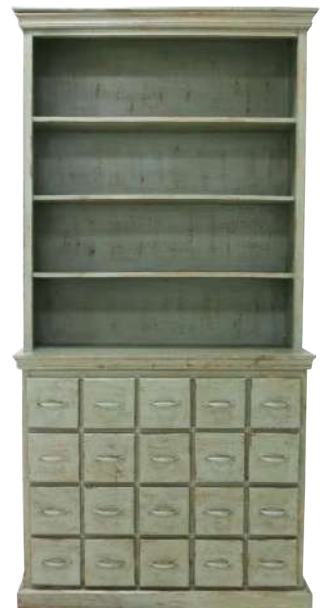
Vintage houten ladekast. 113 x 40 x h 230 cm. € 1.795 (VILLAJIPP.NL)