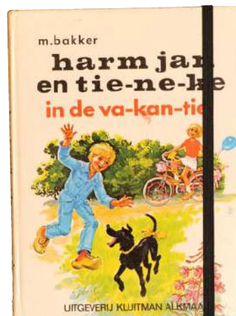
Dit notitieboekje is gemaakt van een oud kinderboek. De eerste pagina's van het originele boek zitten er nog in, voor de rest zijn het blanco pagina's. € 20 (KAFTWERK.COM)