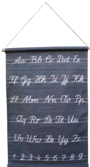
Old school schoolkaart op linnen doek. 88 x 64 cm. € 24,95 (MOUNTAINSMORE.COM)