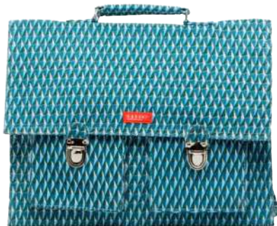
Retro schooltas van textiel. 37 x 30 cm. € 64,99 (SARENZA.NL)